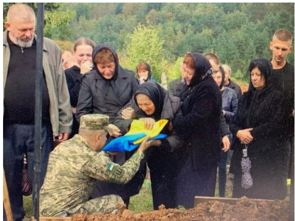
Begräbnis eines gefallenen Soldaten