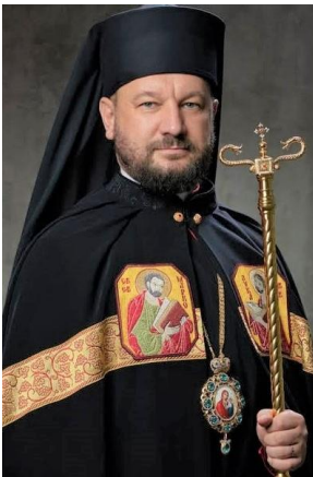
Bischof Teodor von Mukatschewo, Oberhaupt der ruthenisch- griechisch-katholischen Kirche

Spendenkonto bei Kath. Kirchenstiftung St. Ulrich, Habach: DE30 7009 3200 0000 4109 85; Verwendungszweck: Kinderhilfe